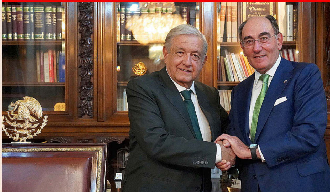
El presidente de México, Andrés Manuel López Obrador, junto al presidente de Iberdrola, Ignacio Sánchez Galán.