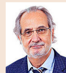
Joan Perdigo Tornos Abogados